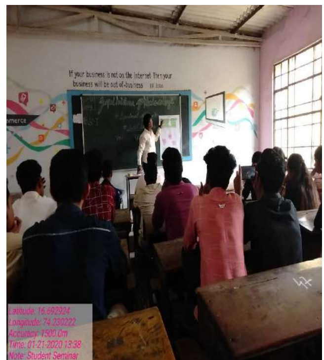
Student Seminar on 21/01/2020 to 25/01/2020