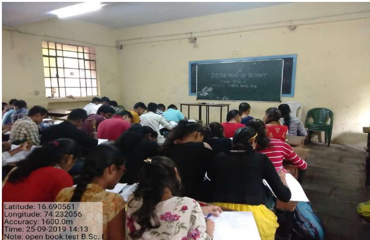
Open Book Test On 25/09/2019 of Class B.Sc. I